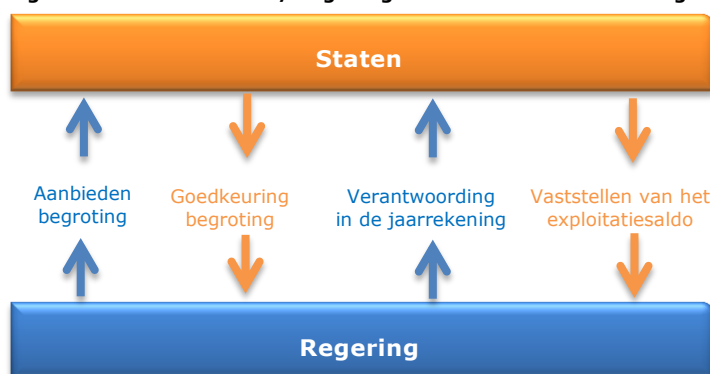
Figuur 1: Relatie Staten/ regering in het kader van het budgetrecht

Het budgetrecht van de Staten kent twee belangrijke momenten, namelijk: